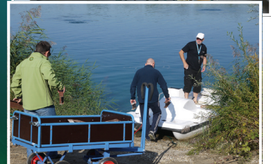
Grand chantier de fabrication et de pose de la nouvelle exposition sous marine.