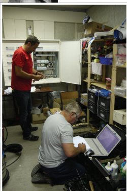
Finitions électriques, l'installation est terminée.

le DP fixe les caractéristiques de la plongée et établit une fiche de sécurité comprenant notamment les noms, les prénoms, les aptitudes des plongeurs et leur fonction dans la palanquée ainsi que les différents paramètres prévus et réalisés relatifs à la plongée.